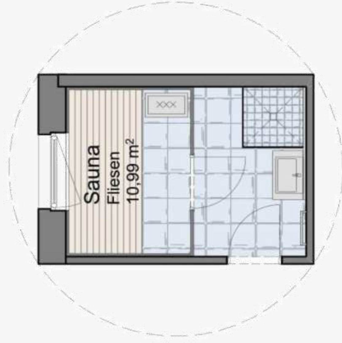
Variante Sauna statt Zimmer 4